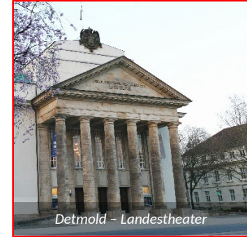
Detmold – Landestheater