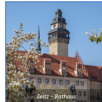
Zeitz – Rathaus