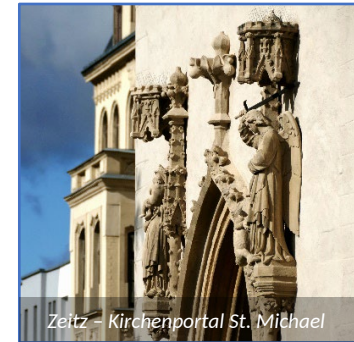
Zeitz – Kirchenportal St. Michael