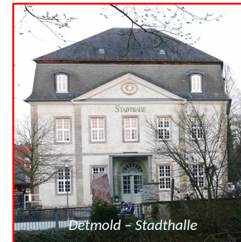
Detmold – Stadthalle