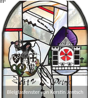
Bleiglasfenster von Kerstin Jentsch

Das ehemalige Steintor (Steintorturm) befindet sich im ältesten Teil der Zeitzer Altstadt. Das ursprüngliche Tor sowie der Turm auf der anderen Seite am Steinsgraben wurden bereits 1848 abgebrochen. Der Halbschalenturm wurde um 1530 erbaut und zusammen mit der anschließenden Mauer aus dem 15./16. Jh. (Rückseite Grundstücke Steinstraße 8, 9 und 10) Anfang der 1990er Jahre saniert. 1993 als Begegnungsstätte für den Partnerschaftsverein Zeitz-Detmold e.V. eingeweiht, kann er heute beispielsweise für Feiern gemietet werden. Heute ist der Steintorturm in Zeitz Treffpunkt, Bildungs- und Ausstellungsort.