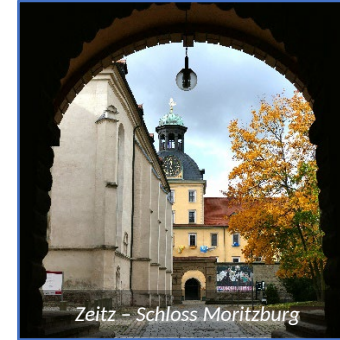
Zeitz – Schloss Moritzburg