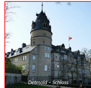
Detmold – Schloss